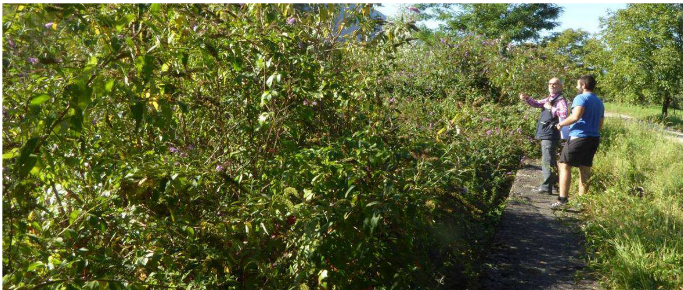
Sponda fluviale a dominanza di B. (07.09.2016)

▲ RILIEVO FLORISTICO PRE-TRATTAMENTO. La prima parte dell'indagine, eminentemente bibliografica, ha inteso raccogliere informazioni di base sulla B., evidenziando che si tratta di una specie ancora poco approfondita a livello europeo; in particolare non appaiono ancora consolidate concrete formulazioni sugli aspetti negativi della B. ai più diversi livelli (idrogeologico, ecologico, botanico, paesaggistico, eccetera). Allo stesso modo non sono state documentate esperienze accademiche che possano indirizzare il controllo della specie al di fuori di generiche, e alquanto inefficaci, operazioni di taglio, estirpazione e diserbo chimico .