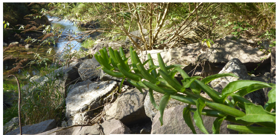
Oenothera sp.: infruttescenza (07.09.)

Il rilievo floristico effettuato sui tre livelli, arboreo, arbustivo e erbaceo, ante pirodiserbo , ha mostrato la presenza della tipica flora ripariale dei fiumi alpini, fortemente influenzata dalla componente esotica (60% delle specie rilevate). L'area d'indagine è caratterizzata da netta dominanza di Buddleja davidii (grado di copertura superiore al 90%) che ha sottratto spazio vegetativo a specie autoctone quali Sambucus nigra , Salix alba , S. eleagnos e S. purpurea . Gli interstizi della scogliera hanno permesso di creare condizioni favorevoli per una sporadica copertura erbacea costituita da specie opportuniste quali Impatiens balfourii , I. glandulifera , Oenothera sp.