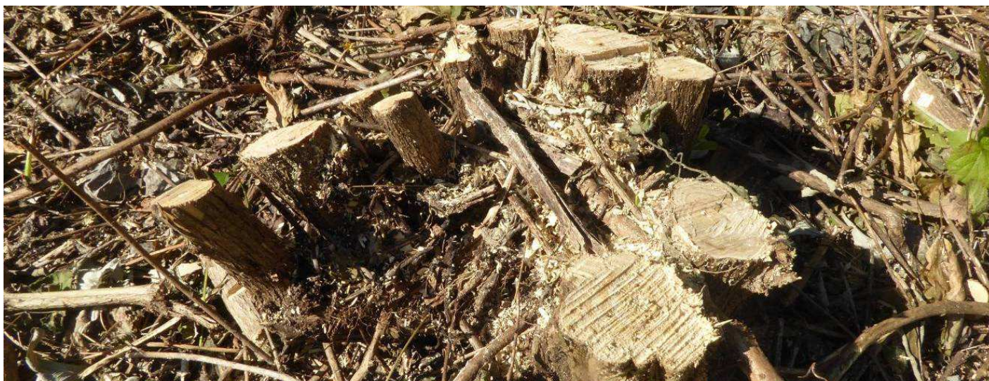
Ceppaia di B. tagliata "a raso"

DATI BIOMETRICI ANTE-PIRODISERBO (3 NOVEMBRE 2016). Per disporre di dati confrontabili nelle diverse fasi di studio, si è proceduto all'analisi biometrica delle singole ceppaie tagliate. Si è scelto di effettuare le misure a due mesi dalle operazioni di taglio per avere indicazioni anche sulla "risposta" vegetativa, ancorché, o soprattutto, rilevabile in una stagione non certamente indicata per la fisiologica di base dei vegetali.