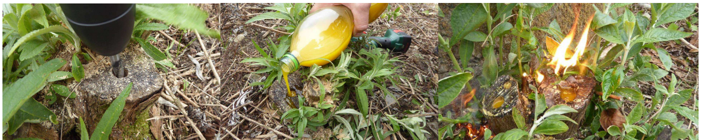
Foratura delle ceppaie mediante trapano elettrico e punte per legno - Riempimento del foro a fondo cieco con la miscela realizzata - Processo di bruciatura lenta