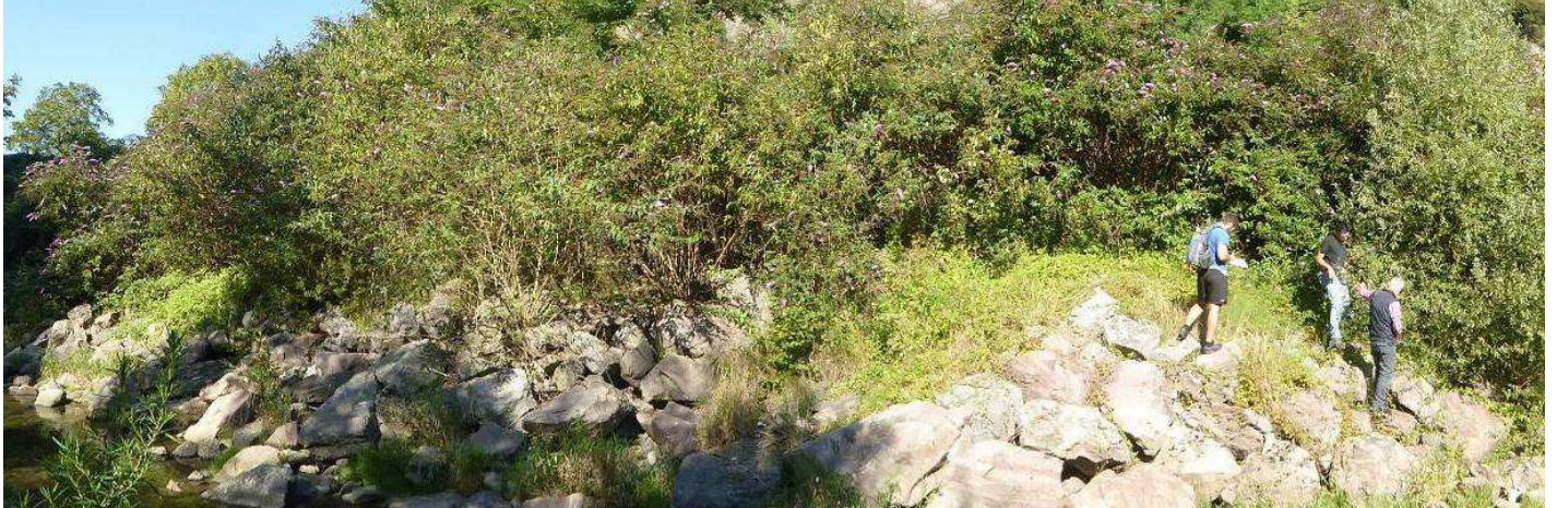
Vista frontale del transetto di studio prima dell'intervento di taglio a raso. (07.09.2016)

La stazione scelta appare particolarmente indicata allo scopo d'indagine per la pressoché totale dominanza di copertura da parte della B. , affermatasi successivamente alla ricostruzione dell'argine mediante scogliera in massi ciclopici (1991). Di grande interesse per la scelta del sito è risultata essere, inoltre, la significativa differenziazione vegetativa con le aree adiacenti che presentano una copertura dominante di rovo ( Rubus sp. ). Si è ritenuto verosimile che il tratto in questione sia stato ritrattato (scavo e riassetto) in tempi più recenti probabilmente per la rimozione di una tubazione di scarico diretto nel fiume (2005-2006), determinando le condizioni ideali per l'affermazione repentina di B. Il substrato del sito è costituito dal terrapieno roccioso della scogliera, realizzata senza l'utilizzo di cemento per semplice posizionamento di terreno vegetale negli interstizi. Non sono stati rilevati segni di integrazione con talee di salice e, pertanto, si può ritenere che la configurazione floristica attuale sia riconducibile unicamente alla successione vegetale naturale dei luoghi. Questo fatto si pone a riprova concreta della "forza" con cui la B. riesce ad affermare comunità vegetali stabili in ambiti difficilmente appetibili dalle più comuni specie vegetali ripariali autoctone.