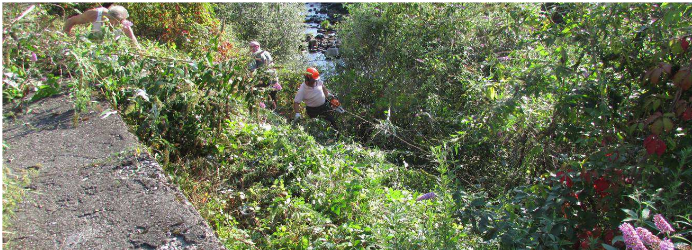
Interventi di taglio "a raso"

INTERVENTO CULTURALE. La superficie è stata sottoposta ad intervento di taglio a "raso". Le operazioni sono state effettuate a cura del personale del Consorzio Forestale Pizzo Camino , operativo in quei giorni su aree adiacenti del Fiume Oglio. Tutto il materiale tagliato è stato oggetto di esbosco e cippatura per il conferimento in centrale a biomassa convenzionata.