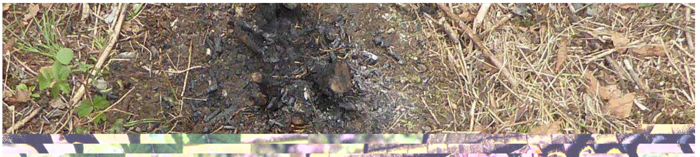
Ceppaia pirotrattata: il fuoco ha intaccato esclusivamente la ceppaia lasciando integro il terreno circostante.