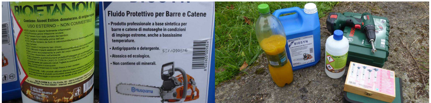
Bioetanolo (70%) - Olio ecologico (30%) - Materiali e attrezzature