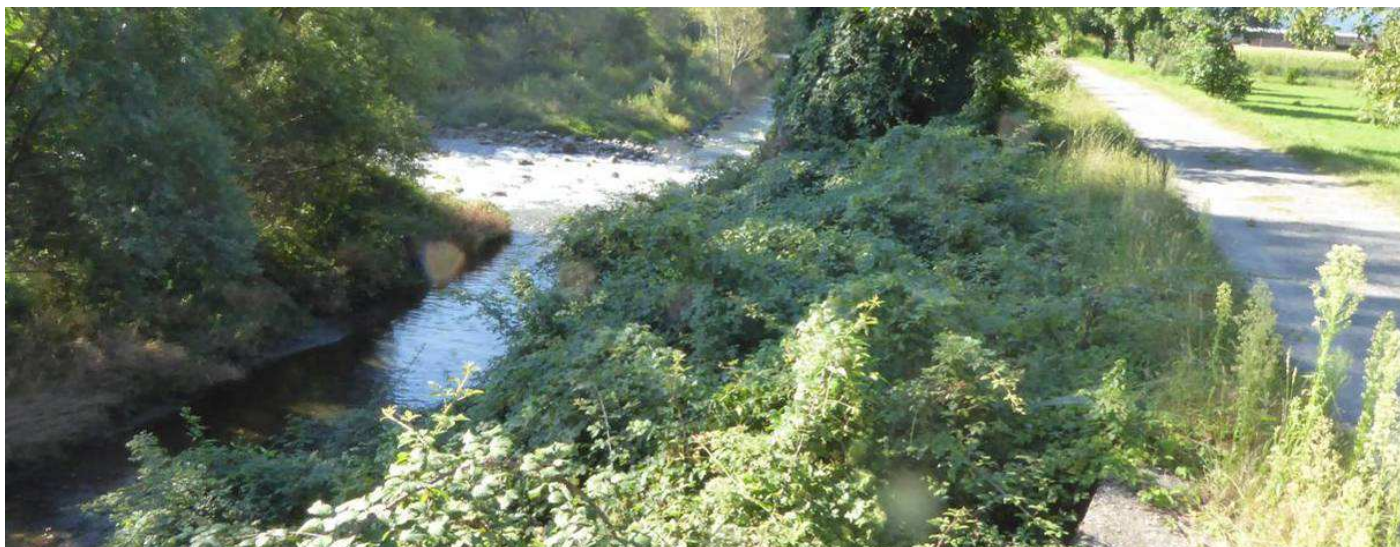
Sponda fluviale a dominanza di Rubus sp. (07.09.2016)